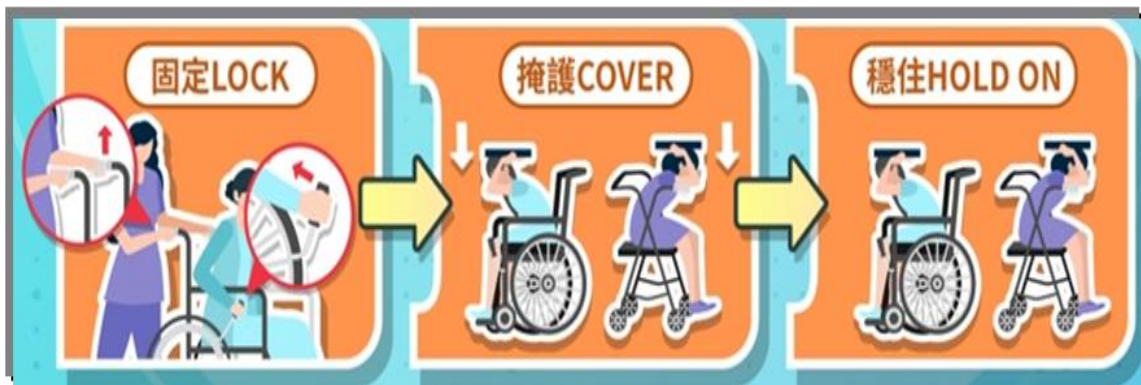
身心障礙朋友地震避難 3 步驟(固定 Lock、掩護 Cover、穩住 Hold on)