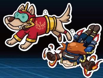
防災特攻造型悠遊卡