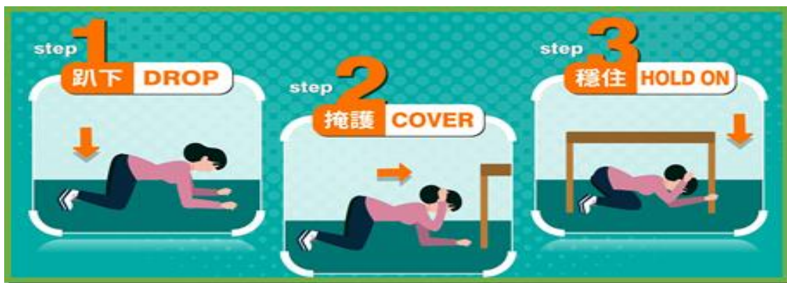
地震避難 3 步驟(趴下 Drop、掩護 Cover、穩住 Hold on)