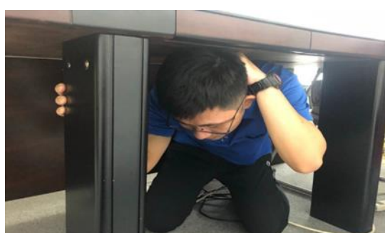
上傳照片動作範例二