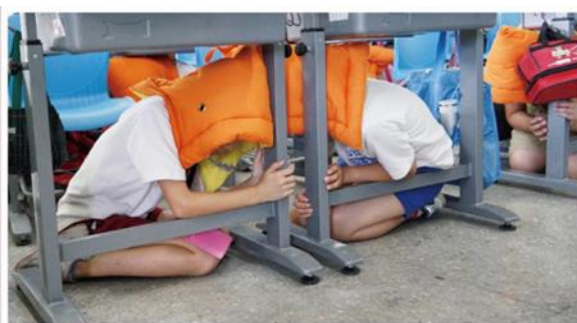
上傳照片動作範例一