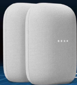
Google Nest Audio 智慧音箱