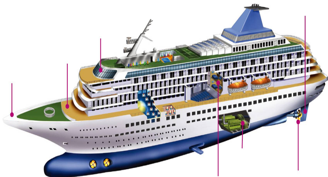
船 船艙 甲板 艦橋 舵 推進器 引擎室 客艙