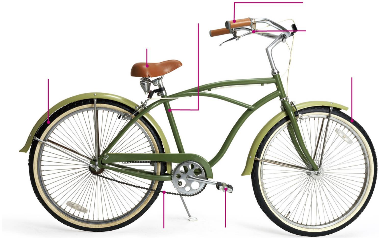
腳踏車 後輪 坐墊 車架 把手 煞車把手 前輪 踏板 鍊條