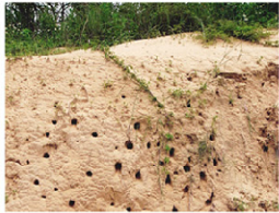
▲栗喉蜂虎會挖掘土洞做巢。

栗喉蜂虎是金門的夏候鳥，每年春夏初會在這裡繁衍下一代。牠們不只外貌出眾，生態習性也相當特殊，會挖掘土洞做巢，集體營巢，甚至會「合作生殖」，不是親鳥的家族成員也會幫忙育幼。