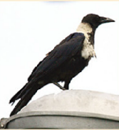
▲稀有鳥種玉頸鴉 (左) 及戴勝。