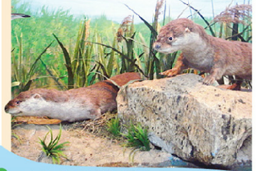
▲半水棲性的水獺。(攝於金門國家公園遊客中心)

，還有許多植被茂密的棲地；各水域連接形成大範圍水域，又有養魚，提供豐富的食物，而成為臺灣水獺最後的淨土。