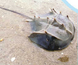
▲鬚的背面是不是很像馬蹄？翻過來看腹部，牠跟螃蟹一樣有十隻腳。

金門近幾年開放觀光，大園土木，不但汙染原本的環境，也破壞了生物棲地。現在最重要的，就是怎麼保護這些特殊生物呵！