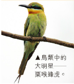
▲鳥類中的大明星——栗喉蜂虎。

金門縣有臺灣第六座國家公園，不僅是第一座位在離島的國家公園，也是第一座以維護歷史文化資產、戰役紀念為主，並兼具自然資源保育功能的國家公園。 金門位在大陸邊緣，是候鳥重要的中繼站，目前已記錄的鳥種就有三百種。因為緊鄰中國大陸，生物相和臺灣差異很大，在金門很普遍的斑翡翠、栗喉蜂虎等，在臺灣還不曾看見；金門常見的戴勝、玉頸鴉等，在臺灣很少見。因此一年四季到金門賞鳥都有不同驚喜。 接著來看看金門重要的「陸海空動物三寶」吧！