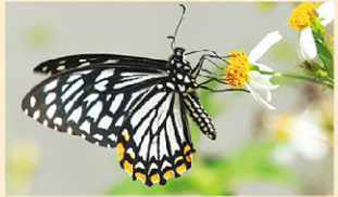
▲黃邊鳳蝶 (又名大斑鳳蝶)，臺灣只有金門有分布。