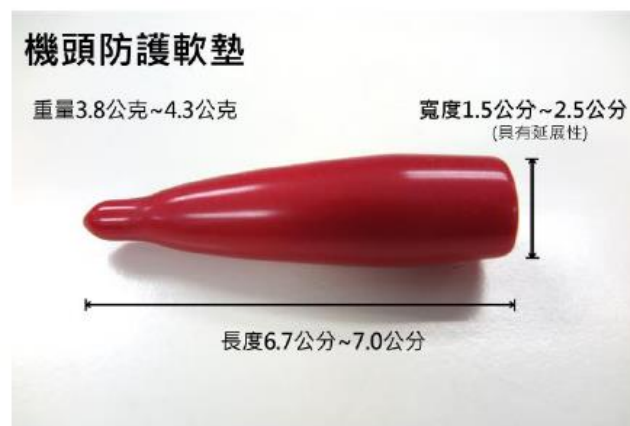
圖 1 機頭塑膠軟套