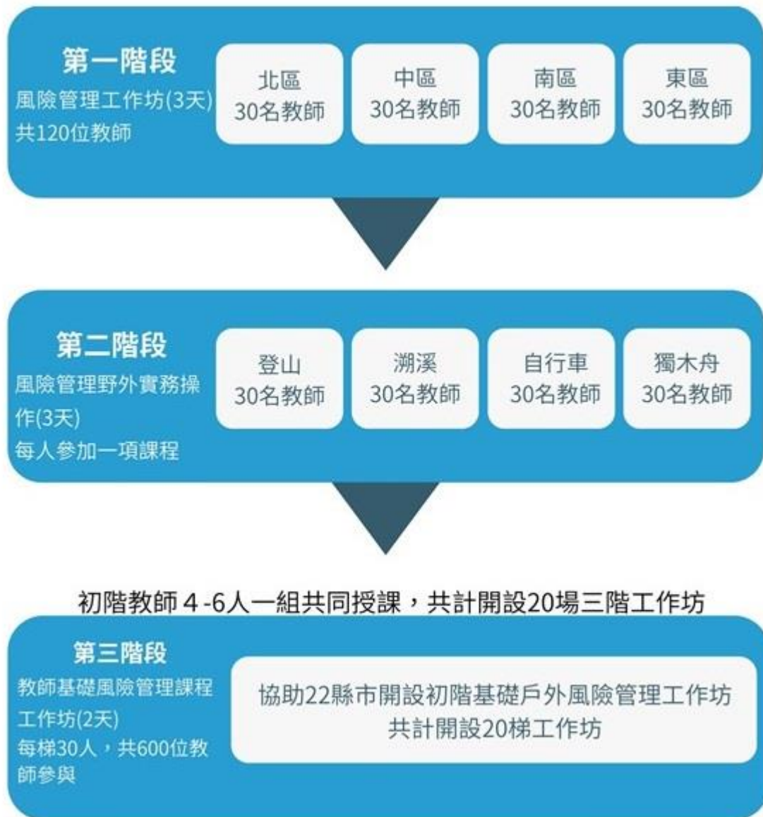
圖一 培訓計畫課程安排