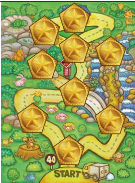
(上圖為遊戲开始前準備圖樣)