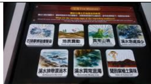
(上圖為 7 個正確答案)