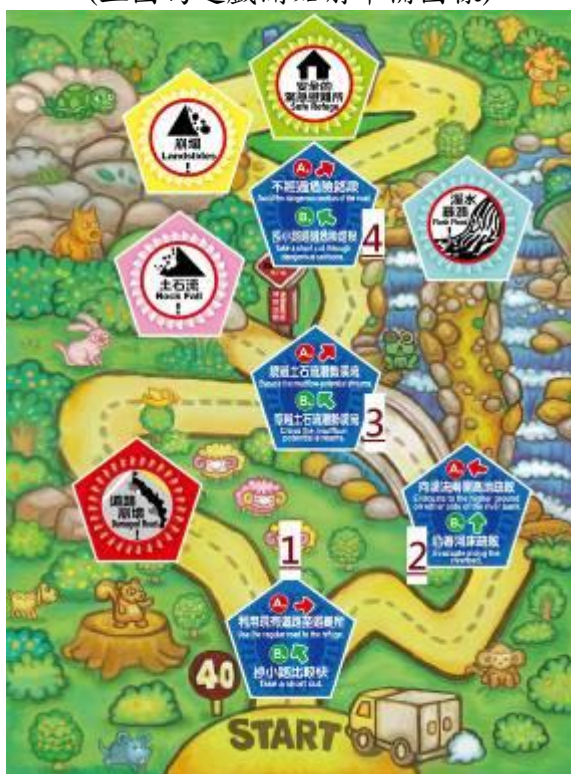
(上圖為所有磁鐵相對應擺放圖樣)

2.再將五組鑰匙放置於左側箱面上，並將貼有(R)字樣的密碼鎖頭將遊戲箱上鎖，即準備完成。(如下圖)