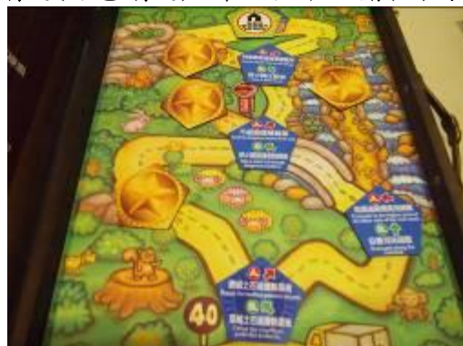
(上圖為正確答案路線圖)

1.如下圖所示，依序選擇磁鐵上的正確選項，即可依指示抵達終點，按照提示取得正確鑰匙(綠色鑰匙)，即可往下一關(M)前進。