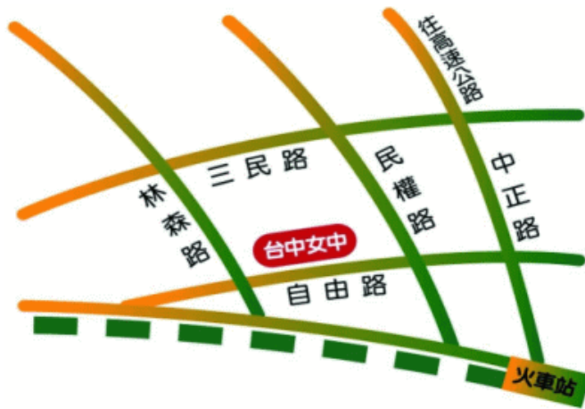
臺中市立臺中女子高級中等學校 110 學年度校園配置圖