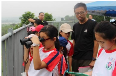
透過雙筒望遠鏡找出遠方字卡內容