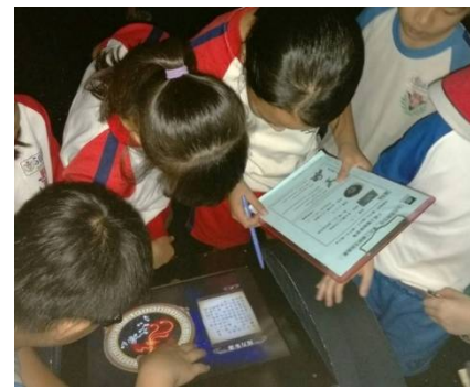
利用硬體展項找出星座與方位關係