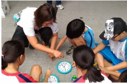
學生實際操作時表法

3-2-2 培養對自然環境的熱愛與對戶外活動的興趣，建立個人對自然環境的責任感。