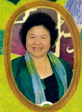
高雄市 陳菊 市長