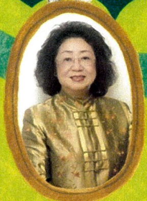
高雄市教育局 范巽綠 局長