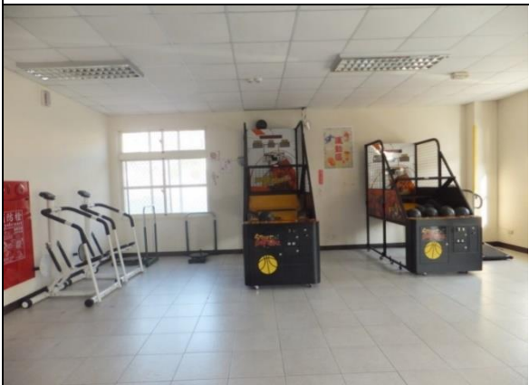
一樓設有籃球機、健身器材