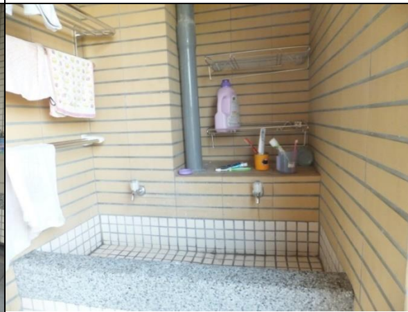
寢室設有獨立洗衣台及曬衣空間