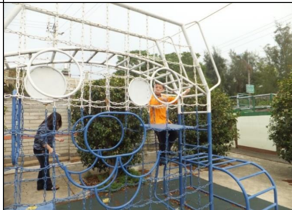
宿舍外有籃球場及遊樂設施