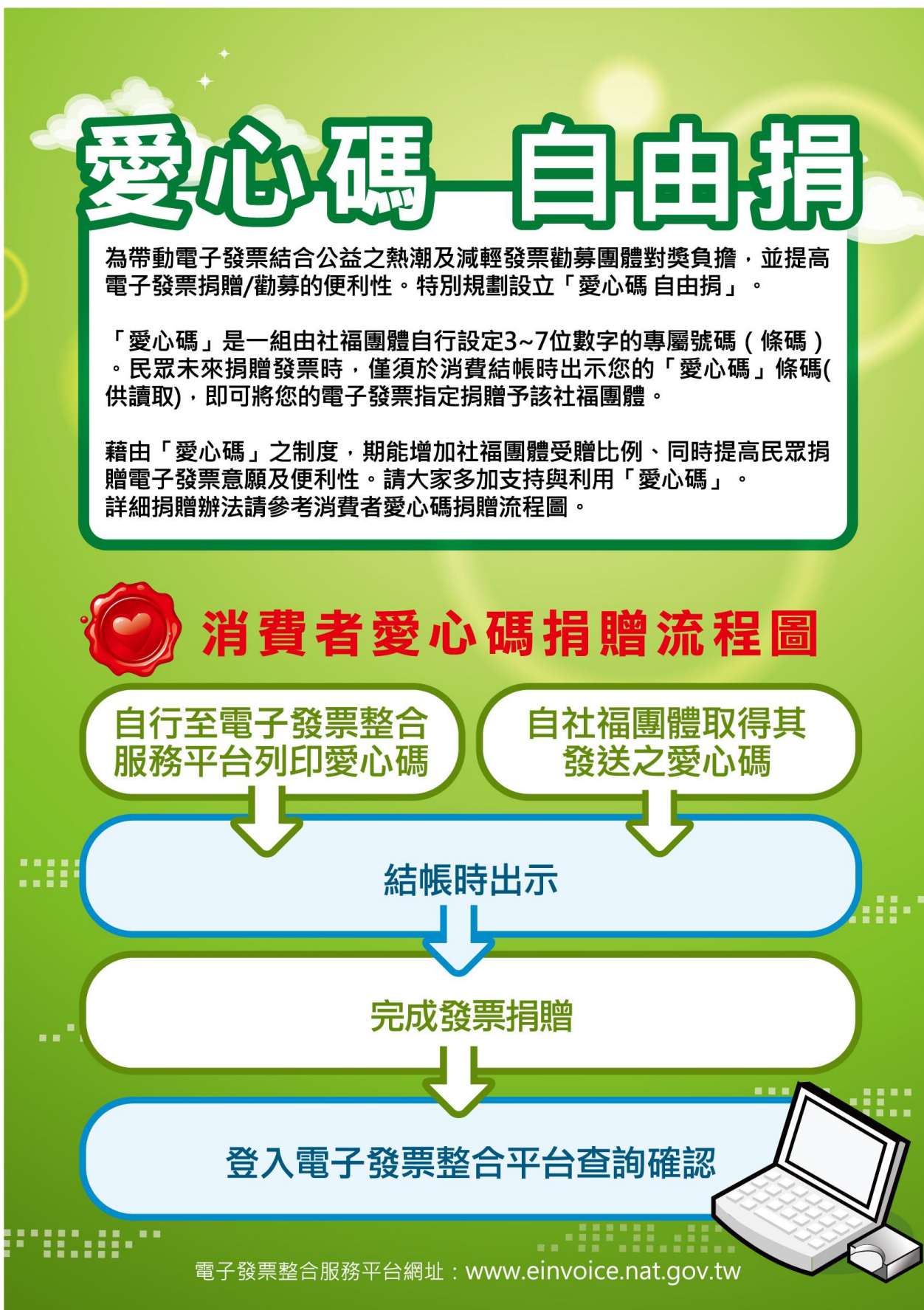
圖 4：愛心碼捐贈流程