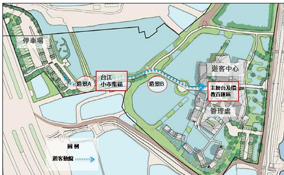
「2021 濕地日」活動空間配置及遊客動線規劃示意圖

邀請對象： 濕地保育相關部會機關、各地方政府、濕地保育利用計畫執行單位(含民間 NGO/NPO 團體)、大專院校等相關科系及在地民眾。