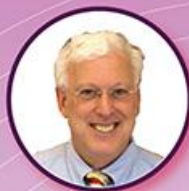
Prof. Robert J. Sternberg Cornell University, USA

Transformational Giftedness, and Why Our Conventional Definition of Giftedness Has Become a Disservice to Humanity