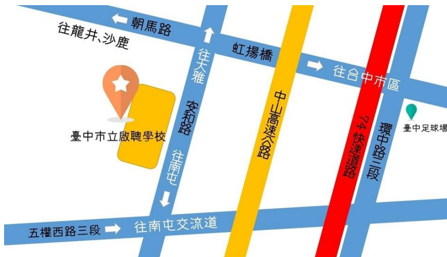
臺中市立啟聰學校位置圖