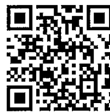
繳件 QR code