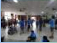
校園藝陣社團平日團練