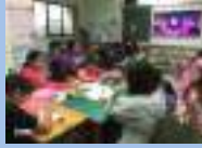
校園藝陣教課教學