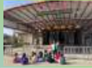
實地認識宮廟及藝陣歷史文化