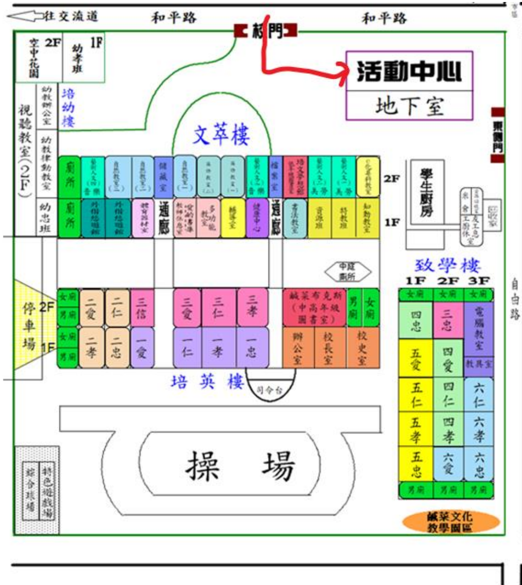
附件 5：麻豆區培文國小比賽場地位置圖