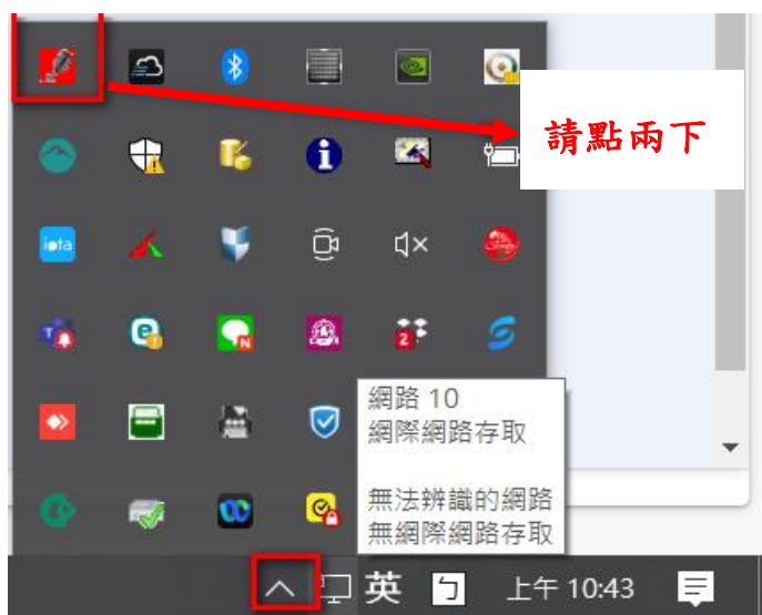
圖- 4 點選簽章工具