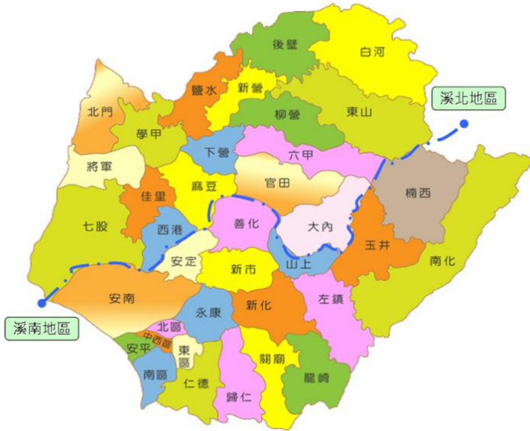
溪北及溪南行政區劃分示意圖