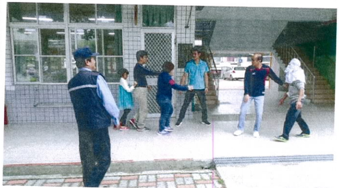
小朋友第一時間通報行政人員與警衛協助處理