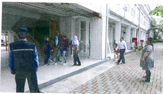
校長主任警衛勸導歹徒勿影響學生上課