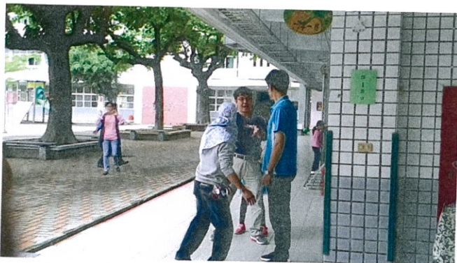
級任導師試著安撫歹徒情緒並拖延時間