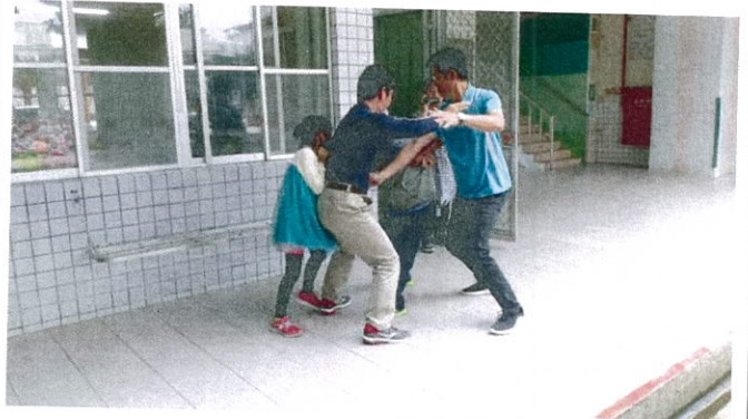
本校人為災害模擬演練：歹徒進到校園欲帶走學生