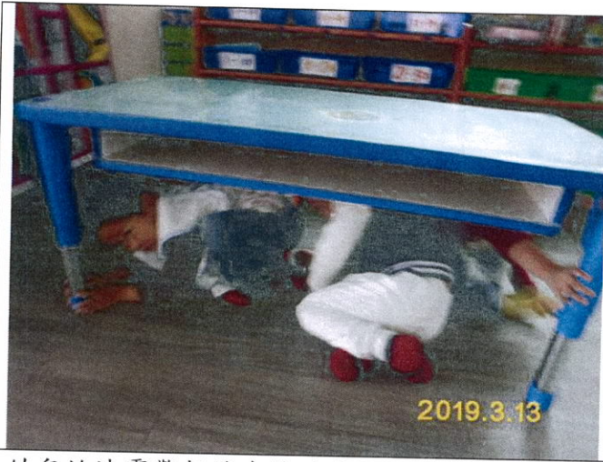
幼兒於地震警報發布後確實執行趴下掩護穩住等動作