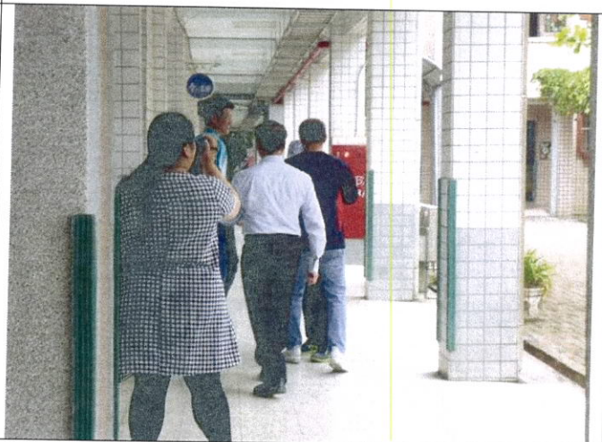
有甚麼事到辦公室談別影響學生