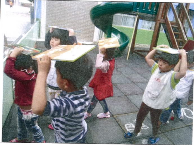
警報結束後保護頭部迅速至安全指定位置集合