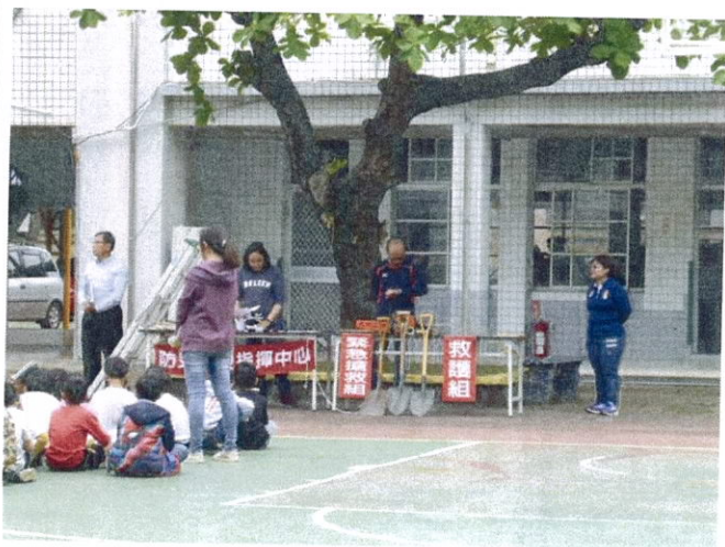
學生以最快速度離開建築物至集合地點