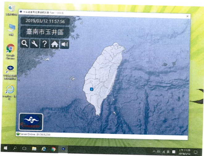
氣象局地震即時訊息系統