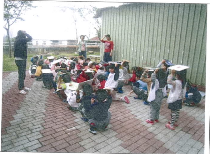
幼兒集合完畢老師確實清點人數