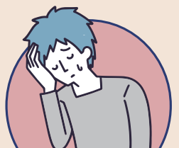
感染愛滋等血液傳染病