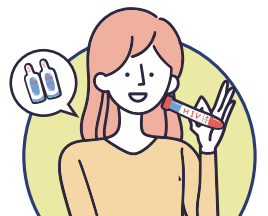
每3-6個月定期接受 愛滋篩檢