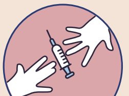
共用針具或稀釋液