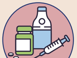
海洛因等藥物濫用