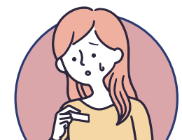
感染愛滋、梅毒等 性傳染病