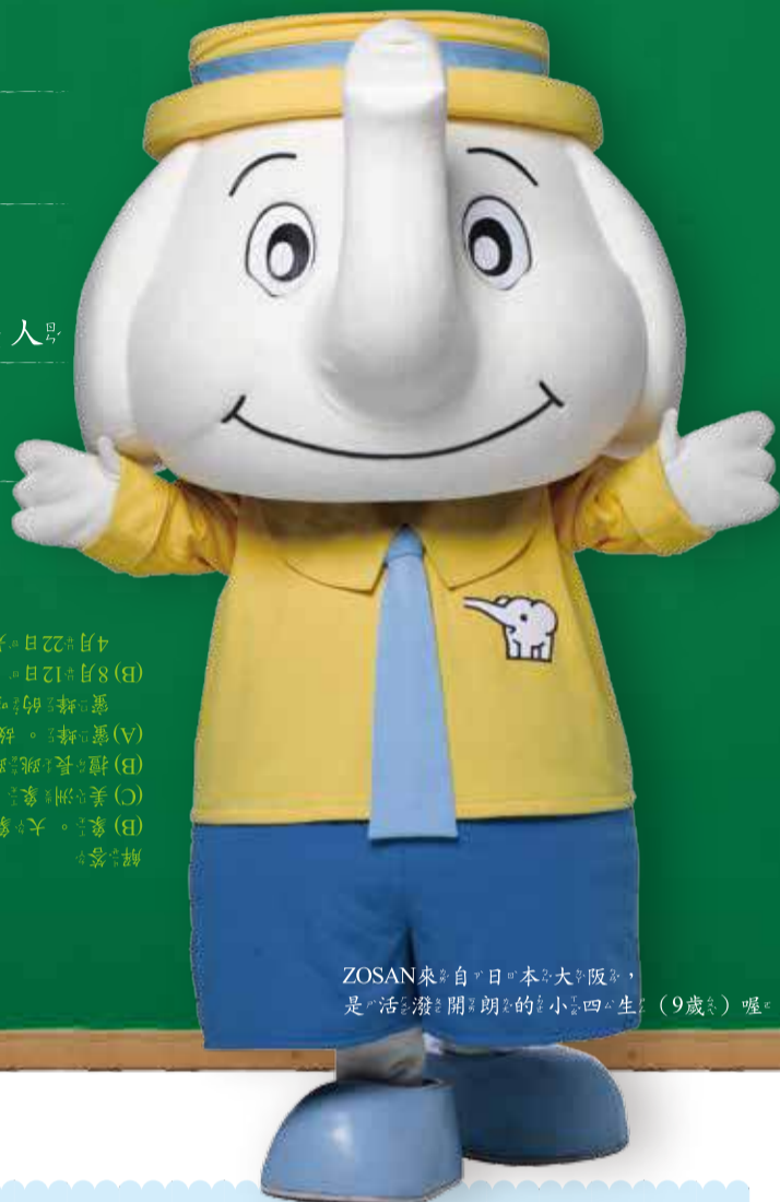
ZOSAN來自日本大阪，是活潑開朗的小象四生（9歲）喔！

解答： (A) 象。大象身高2.5-4公尺，體重高達2-7公噸（1公噸=1,000公斤），不單是陸地上最大的動物，也是目前地球上最大的動物。 (B) 8月12日。為了呼籲人們保護大象，而設立的大象日。 (C) 老鼠。大象的恐懼症。 (A) 蜜蜂。故事裡總將大象描述成害怕老鼠的動物，其實大象害怕蜜蜂。 (B) 擅長跳躍。大象的骨骼與體重的關係，是「唯一」無法跳躍的動物。 (C) 美洲象。現存的大象種類為非洲草原象、非洲森林象與亞洲象。