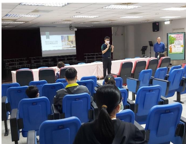
校長親自開場. 介紹