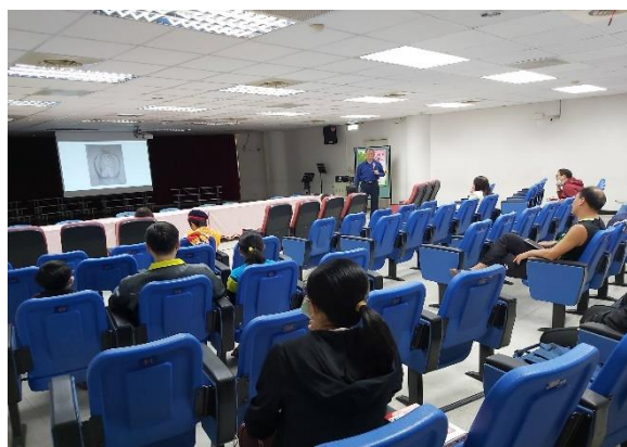
講師講解生命教育課程