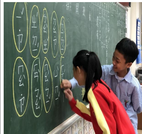
學生認真上課情形