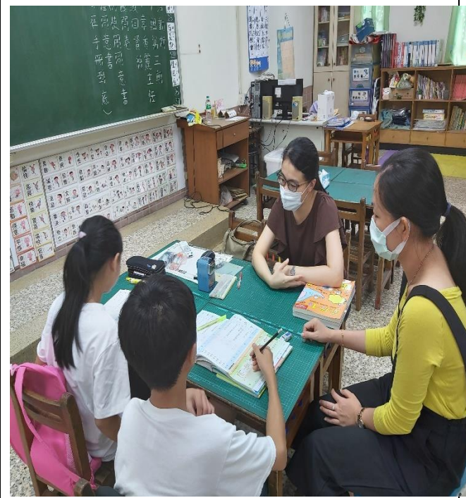
華語教師與通譯員一起授課情形