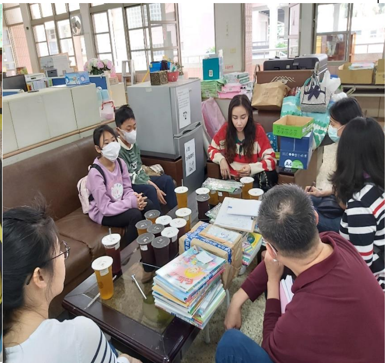
各班導師與家長開會討論