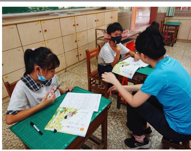
學生平常授課情形