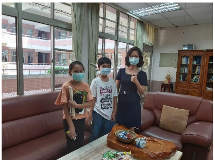
校長時時關心孩子授課情形