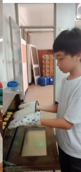
多元學習(國樂及烹飪課)