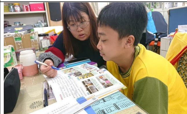
學生認真上課情形