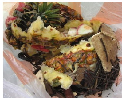
生蔬菜殼或蔬菜梗