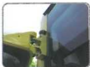
車身左側攝影鏡頭