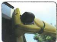
車身右側攝影鏡頭