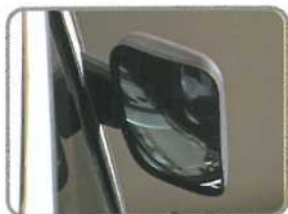
車身右側近側視鏡