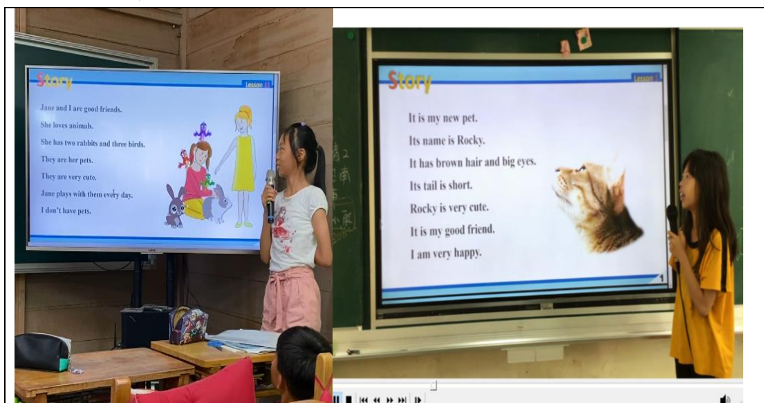
高年級學生閱讀/朗讀情形