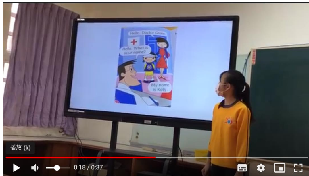
中年級學生閱讀/朗讀情形