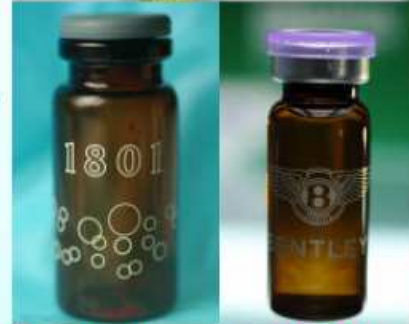
Mephedrone (喵喵)、 bk-MDMA、MDPV (浴鹽) 等安非他命類毒品