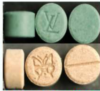
MDMA、MDA、PMMA 等安非他命類毒品