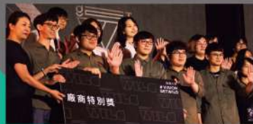
- 學生作品「調音師」屢創佳績，榮獲放視大賞