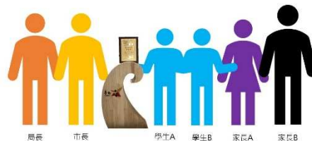
受獎位置-雙胞胎(先個別拍照+後全家合影)