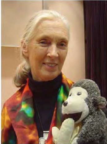
珍·古德 Dame Jane Goodall 又名珍·范羅伊-克·古德

1934年4月3日生(79歲) 英國生物學家、動物行為學家 和著名動物保育人士。