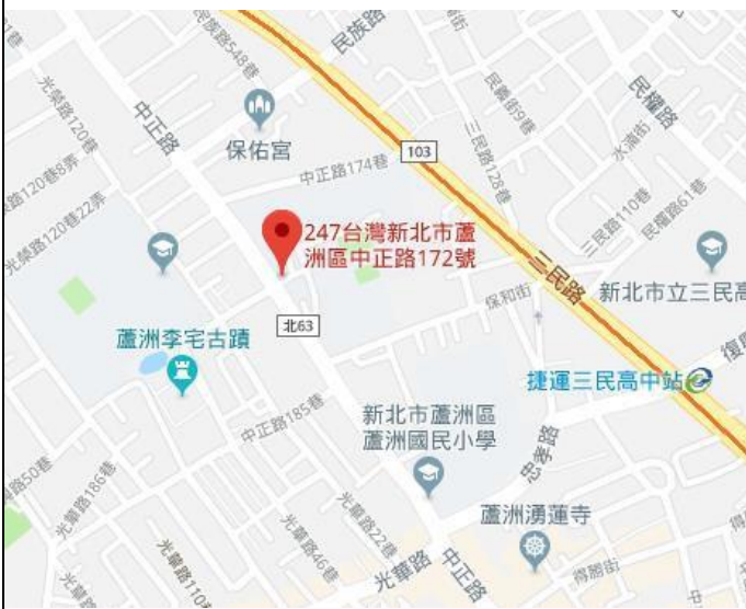
國立空中大學位置圖