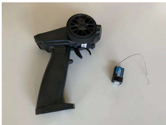
市售 3 通道 2.4GHz 槍型遙控收發器

本競賽禁止使用市售 2 通道、3 通道或多通道之 2.4GHz、27MHz (或其他頻率) 槍型或板型遙控收發器 (或由類似控制元件組合) 作為控制遙控帆船之裝置 (如下二圖所示)，違者以 失格 認定。