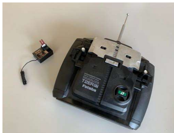
市售 3 通道 27MHz 板型遙控收發器