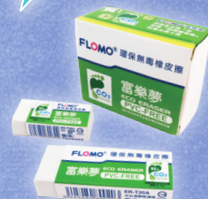
富樂夢 12 色香味彩色筆 環保橡皮擦 5 入分享盒