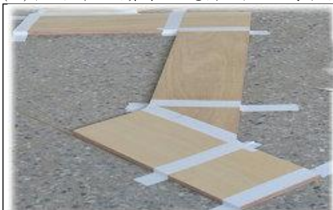
低年級競賽場地示意圖(3 段 2 彎)

(一)中、低年級競賽場地示意圖如下：正式的競賽場地組合於競賽當天 9：00 公佈。