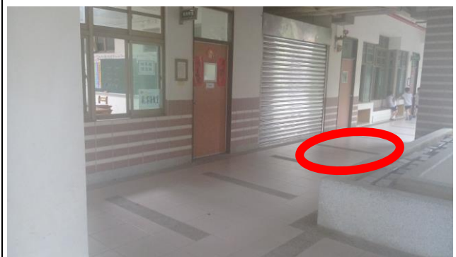
123 通道(語言教室旁) (C 棟、南棟 1F)