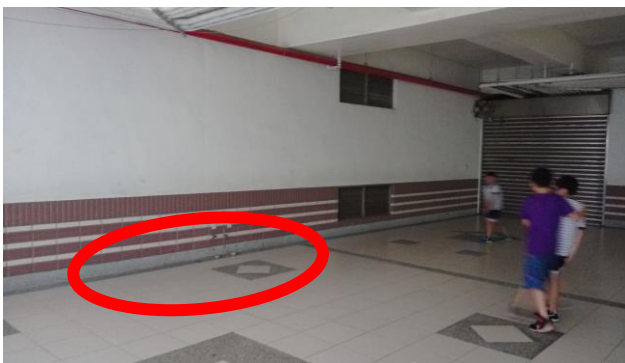
201 教室前(123 通道空地) (北棟、中棟、永信樓 1F)