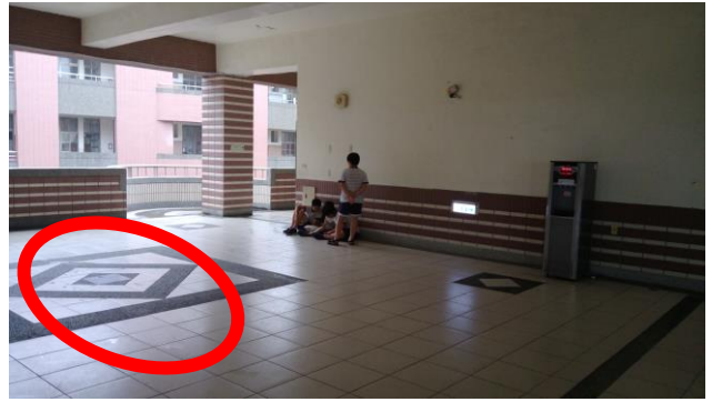
視聽教室前 (北棟、中棟、永信樓 4F)