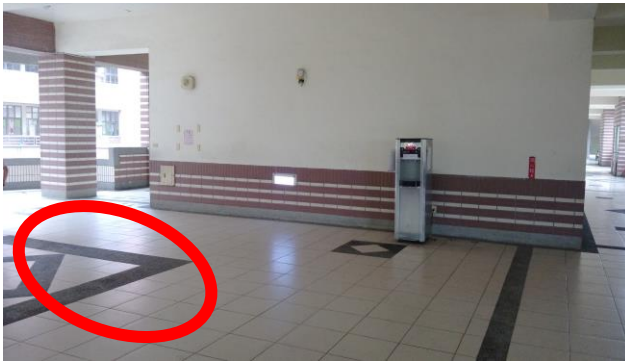
圖書館前 (北棟、中棟、永信樓、南棟 3F)