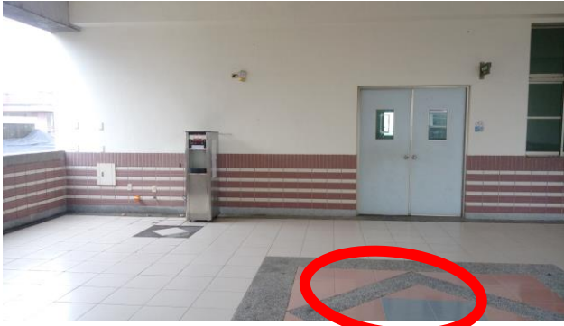
樂活教室前 (北棟 5F)