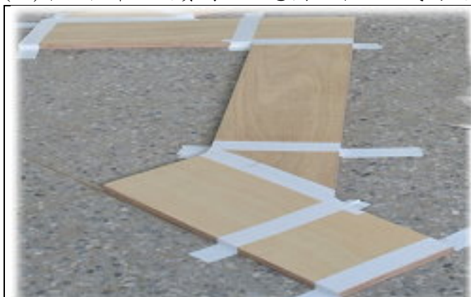
低年級競賽場地示意圖(3 段 2 彎)

(一)中、低年級競賽場地示意圖如下：正式的競賽場地組合於競賽當天 9：00 公佈。