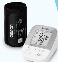
藍牙電子血壓計3名