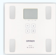
藍牙體重體脂計3名