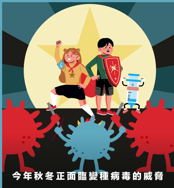
今年秋冬正面臨變種病毒的威脅