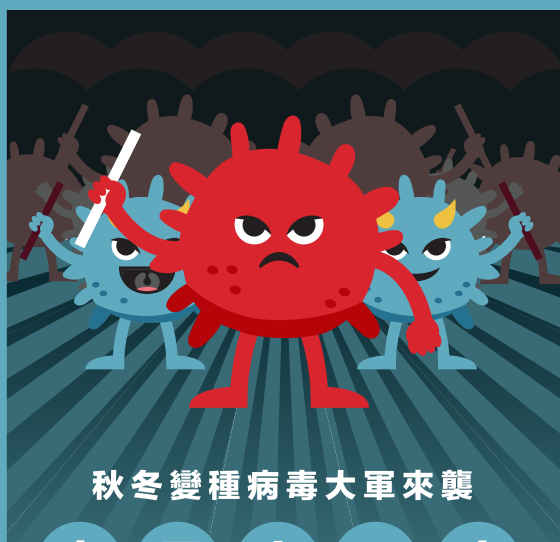
秋冬變種病毒大軍來襲