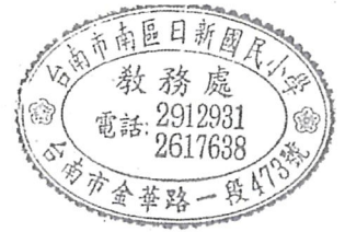
臺南市113學年度日新國小2升3年級常態編班編入班級學生名冊