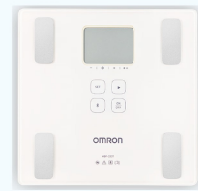
藍牙體重體脂計3名