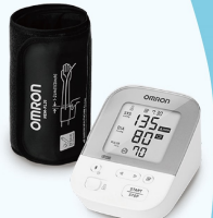
藍牙電子血壓計3名